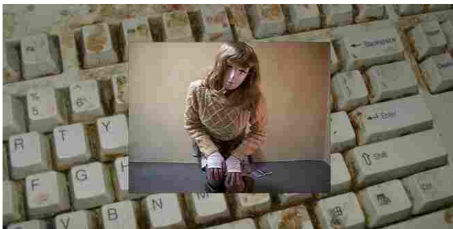
Jon Rafman, Still Life (betamale)

Home » Rubriche » Annunci e proposte » Jon Rafman Il viaggiatore mentale Inaugurazione: 14 set.ore 18 dal 14 set al 24 feb.2019 Galleria Civica di Modena