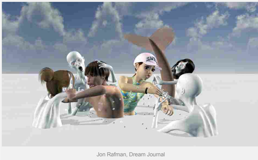
Jon Rafman, Dream Journal

opere. In A Man Digging (2013) composto da sequenze di videogiochi, tra cui Max Payne 3, il protagonista parla dell'intrinseca mutabilità della memoria, in quanto dispositivo esperienziale che permette di riscrivere la storia personale e collettiva. Mentre il narratore va alla deriva, alla ricerca nostalgica del suo frammentato passato, Rafman ci porta, attraverso la superficie luccicante della memoria, ai limiti della realtà. Il video Remember Carthage (2013) narra la storia di un uomo che si imbarca su una nave diretta in Tunisia alla ricerca di una città nel deserto del Sahara che esisteva all'epoca di Cartagine. Malgrado questo luogo leggendario fosse conosciuto come la "Las Vegas del Maghreb", di esso non rimane alcuna traccia. Nel video, composto da sequenze tratte sia da Second Life che dal videogioco Uncharted 3, c'è una voce fuori campo che descrive minuziosamente la sublime bellezza architettonica delle civiltà antiche. Remember Carthage si addentra non solo nel tema della memoria, ma anche in quello della contemporaneità della Storia, poiché, grazie alle più moderne tecnologie come quelle dei videogiochi e di Second Life, anche il passato può assumere nuove forme ed esercitare una nuova influenza.